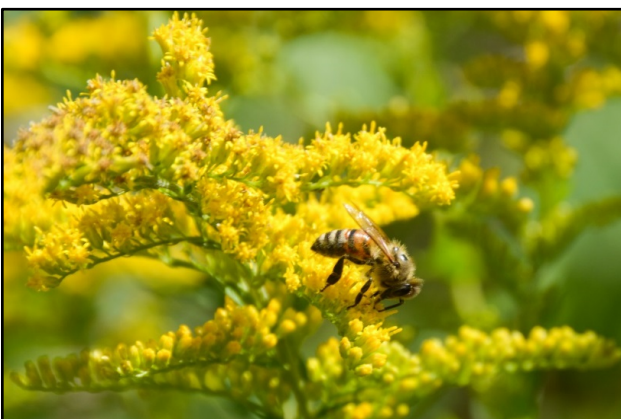
Photo prise par Daniel Tobias à Weir's Lane Lavender & Apiary, Dundas, Ontario

Au cours des dernières années, des préoccupations ont été formulées quant à l'augmentation spectaculaire des pertes de colonies d'abeilles domestiques durant la période hivernale au Canada. Historiquement, les pertes moyennes de colonies d'abeilles durant l'hiver oscillent entre 10 et 15 % au Canada; ces pertes ont toutefois augmenté au cours des neuf dernières années, pour atteindre 29 % 4 . Dans certaines régions du pays, les pertes de colonies d'abeilles ont atteint des niveaux alarmants. Les apiculteurs de l'Ontario rapportent avoir perdu 58 % de leurs colonies durant l'hiver 2013, et 38 % de celles-ci durant l'hiver 2014 5,6 . Pour sa part, la productivité de miel a décliné de plus d'un kilogramme par colonie entre 1998 et 2013 au Québec 7 .