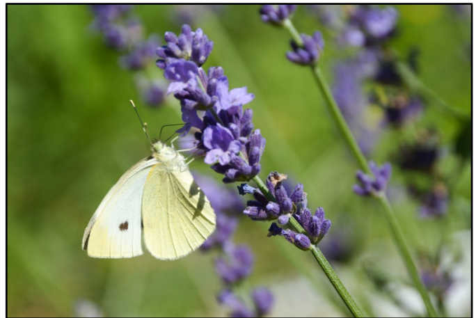
Photo prise par Daniel Tobias à Weir's Lane Lavender & Apiary, Dundas, Ontario

Ces pesticides sont dits systémiques, car ils se répandent dans l'ensemble de la plante traitée pour ainsi se retrouver dans son pollen, son nectar et tous ses tissus, incluant donc la chair des fruits et des légumes que l'on consomme. Bien qu'ils puissent être pulvérisés sur le feuillage ou ajoutés au sol, ils sont le plus souvent appliqués directement sur les semences. L'exposition des animaux qui pollinisent les plantes à fleurs — tels que les abeilles — se fait par le nectar, le pollen, ou encore par la poussière générée lors des travaux de semis faisant appel à des semences traitées aux néonicotinoïdes 2 .