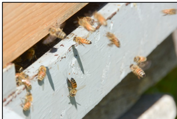
Photo prise par Daniel Tobias à Weir's Lane Lavender & Apiary, Dundas, Ontario

Les abeilles domestiques sont importantes pour l'économie et le secteur agricole de l'Ontario. La production de miel dans cette province représente un marché de 26 millions de dollars 5 . Les abeilles domestiques et les bourdons élevés en Ontario pollinisent dans cette province des cultures agricoles dont la valeur annuelle est d'environ 897 millions de dollars. Ce montant représente approximativement 13 % de la valeur totale des cultures en Ontario 5 . Les abeilles domestiques de l'Ontario sont également transportées dans l'est du Canada pour polliniser des cultures de bleuets et de canneberge qui valent environ 71 millions de dollars 5 .